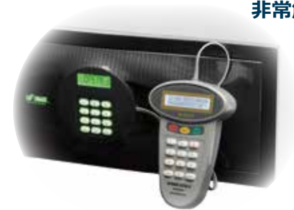
非常解錠・解錠履歴管理

セーフマークシリーズは小物の貴重品だけでなく、15インチ、17インチそれぞれのノートパソコンも格納可能なサイズで前開き、上開きなど設置条件に合わせた製品タイプをお選びいただくことができます。