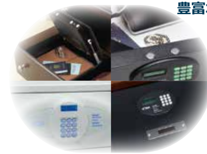
豊富な製品ラインアップ

セーフマークは世界のホテルランキングTOP20が認めるホテルセーフです。200万件の設置実績を誇るホテルセーフは安全・安心で、ホテルに滞在するお客様のどのようなニーズにも対応します。ラグジュアリーホテルからエコノミーホテルまで、豊富なラインアップで様々な場所に設置することができます。